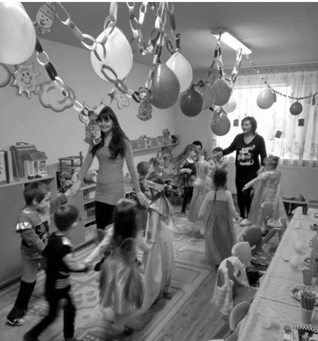
Farsang a nagybudafai óvodában