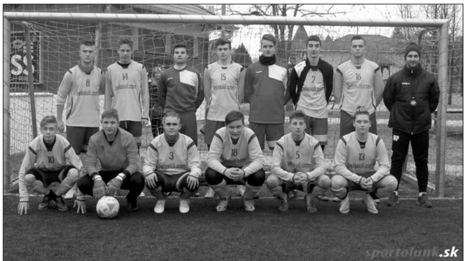
Fent: U19, Rifo Cup, lent: U15, teremfoci