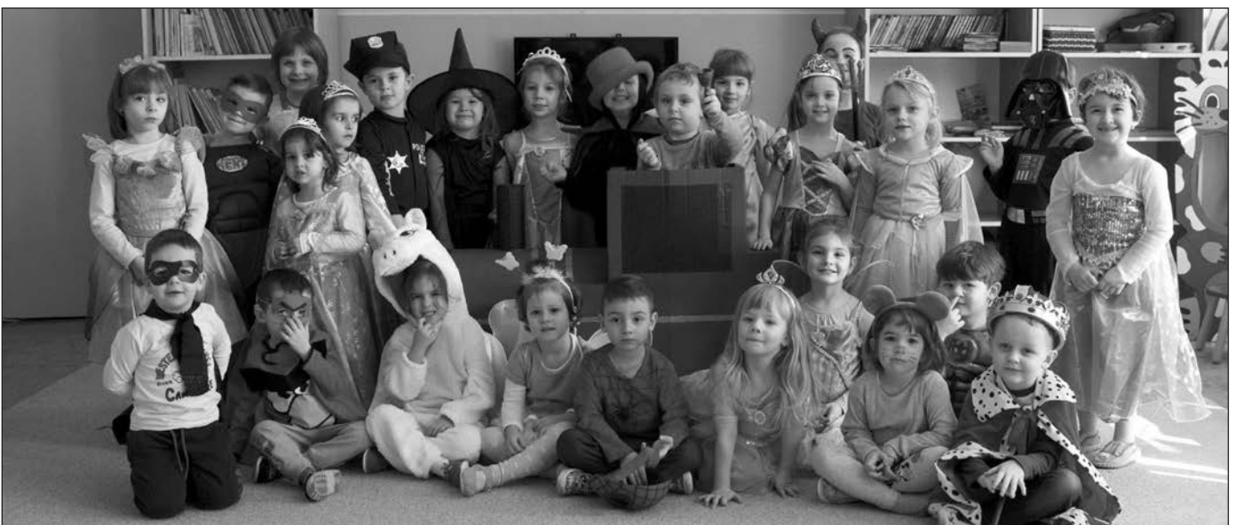
Így farsangoltak a gellei ovisok...

A helyi óvodák igazgatói kérik a szülőket és a segítőkész támogatókat, hogy jövedelemadójuk 2 %- át szíveskedjenek felajánlani az óvodák javára. Közelebbi információt, nyomtatványokat az óvodákban kaphatnak. Minden befolyt összegért hálásak vagyunk!