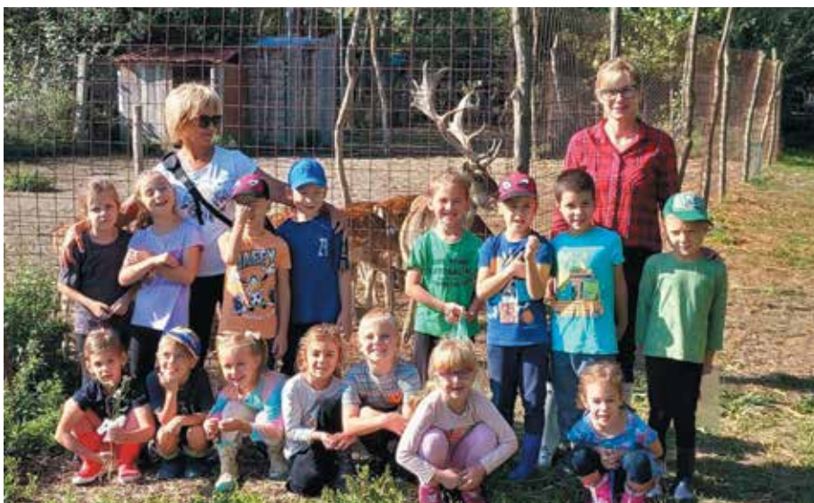
GELLEI ÓVODA PILLANATKÉPEI

A karácsonyi ünnepekre versek, énekek tanulásával készülődtek az óvodások, amelyeket a vásártéren, a karácsonyi vásárban előadtak.