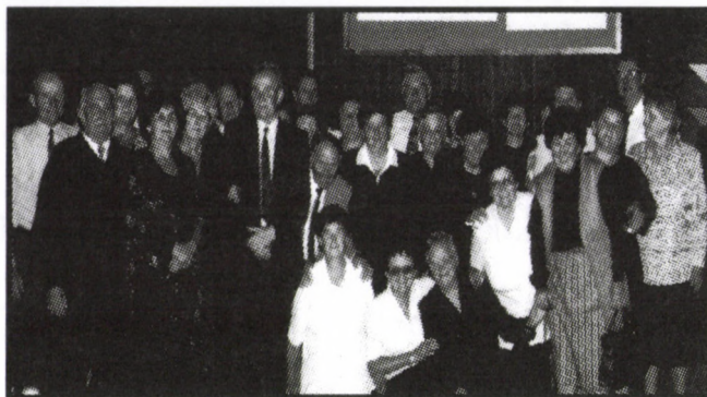
Fontos, hogy merjünk előre nézni. A nyugdíjasklub egy csoportja.