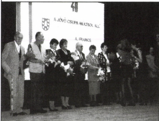
A kitüntetett pedagógusok egy csoportja.