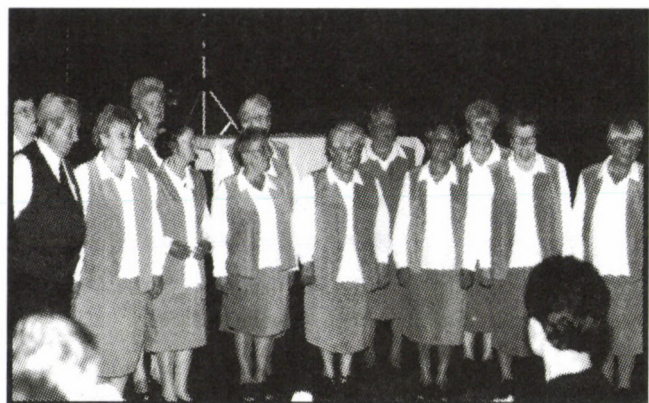
A Győr-ménfőcsanakai nyugdíjasklub dalköre meghatóan szép műsorával szórakoztatta a jelenlévőket

Bizunk benne, hogy a jövőben Ménfőcsanakon ott folytatjuk majd, ahol nálunk, Egyházgellén abbahagytuk. Köszönetet mondunk azoknak a magánszemélyeknek és vállalkozóknak, akik segítettek bennünket, s akik nélkülük ez a szép találkozó nem jöhetett volna létre.