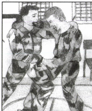
Kiss Márta rajza.

Bücsúzól megkérték tanulóinkat, hogy készítsenek rajzokat és verseket a kommandósokról, melyek közül kiválasztják a legjobbakat és a legközelebbi alkalommal megjutalmazzák azok készítőit.