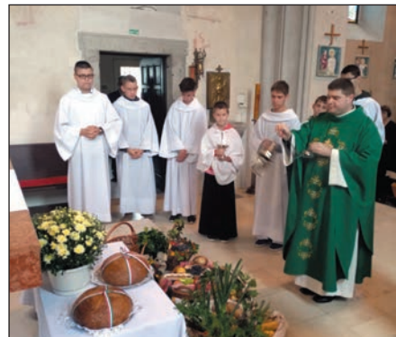
Az eseményről a 2. oldalon tájékoztattunk.