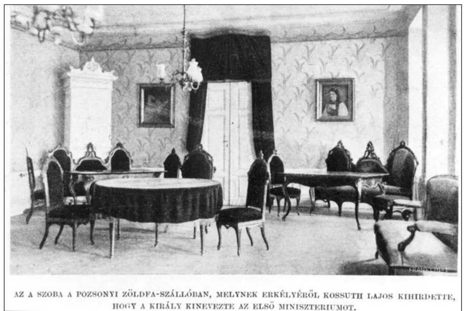
AZ A SZOBA A POZSONYI ZÖLDFÁ-SZÁLLÓBAN, MELYNK ERKÉLYÉRŐL KOSSUTH LAJOS KIHIRDETTE, HOGY A KIRÁLY KINEVEZTE AZ ELSŐ MINISZTERIUMOT.