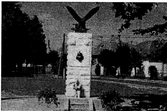
A Turul- emlékmű

Rosszul értelmezik azok ezt a 155 évvel ezelőtti harcot, akik a negyvennyolcas piros-fehér-zöldben csak nemzeti színeket látnak, olyan nemzeti színeket, mely szemben áll más nemzetek színeivel. Ez nem igaz! A piros-fehér-zöld akkor az ön-