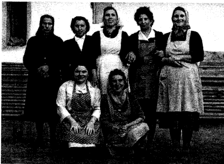
A képkiallítás egyik felvétele