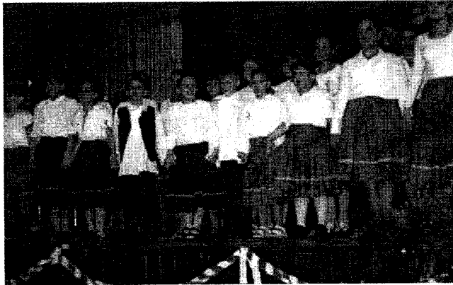
Iskolánk néptáncsoportja hangulatos műsorral szórakoztatta községünk nyugdíjasait

2003. február 21–23-án iskolánk 24 napközis tanulója sítúrán vett részt Bezovec helységben. A szép időnek köszönhetően kicsi és nagy jól érezte magát, kellemesen és eredményesen töltötte ezt a három napot.