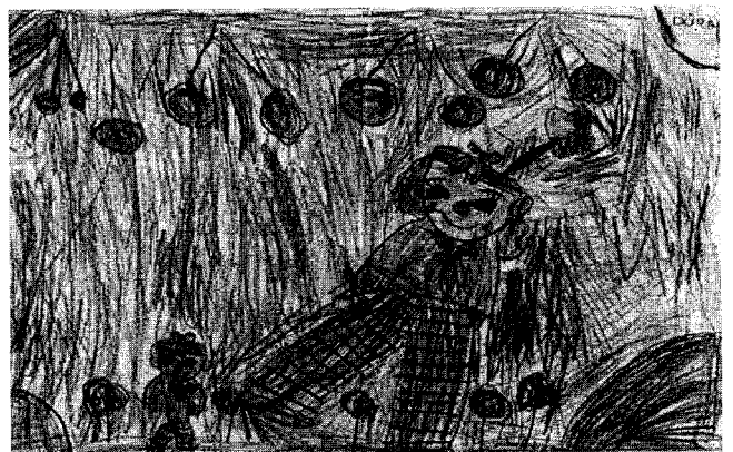
Bohóckodjunk! ~ Németh Dóra (Beketfa) rajza